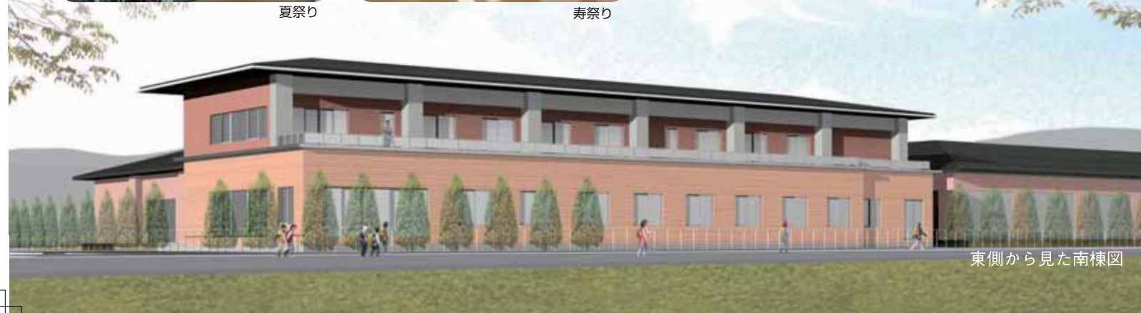
東側から見た南棟図

ボランティアの方々、地域の方々等との交流を大切に、地域社会に開かれた施設づくりを目指します。