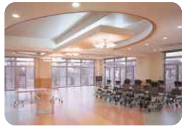
食堂・機能訓練室

広いフロアで大勢の入居者と語らいながら、楽しくおいしい食事がいただけ。心のこもった介助が機能回復への意欲を高めます。