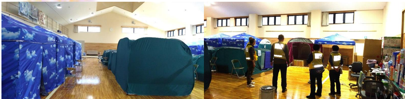
《福祉避難所の様子、レイアウトを再検討しているところ》

福祉避難所で支援をさせていただきましたが、会話の中で時折「どうするかなあ」という言葉が聞かれました。今後のことを思っの重い言葉でした。衣・食・住、全てがままならず先の見通しが立たない現状を抱えている方々に何もできないもどかしさを痛感した活動期間でした。