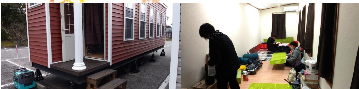
《支援者の居住地、トレーラーハウスの外観・内観、寝袋持参でした》