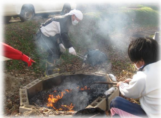
秋の恒例行事 焼き芋大会