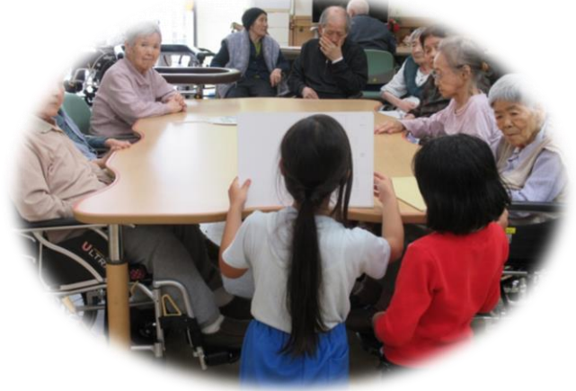
地域小学生の福祉体験交流