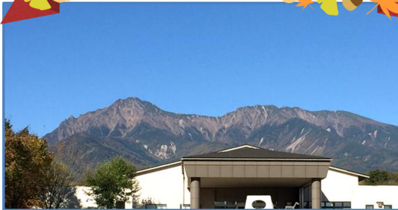
(「特養のべやま」と秋のハケ岳)