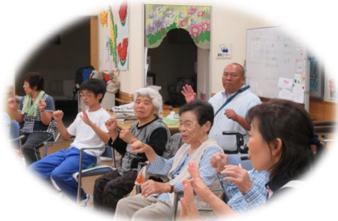
地域中学生の福祉体験学習

※会計年度：平成28年5月1日～平成29年4月30日（既に、本年度の入金を済ませた方はご注意ください。）