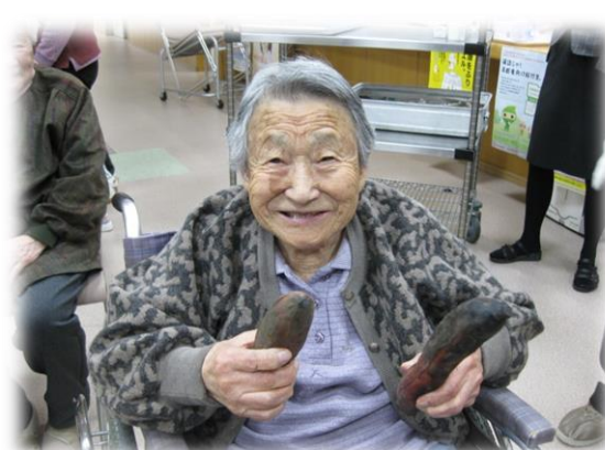
美味しい焼き芋焼けたよ。