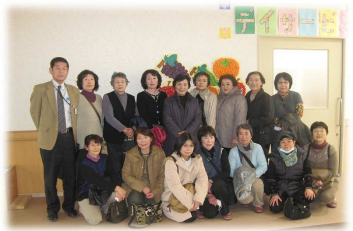
(南牧村ボランティア協議会訪問)